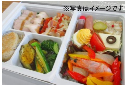
ビール列車特製弁当付き！