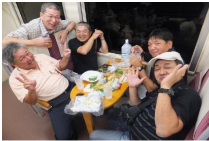
小グループでのお申し込みOK！