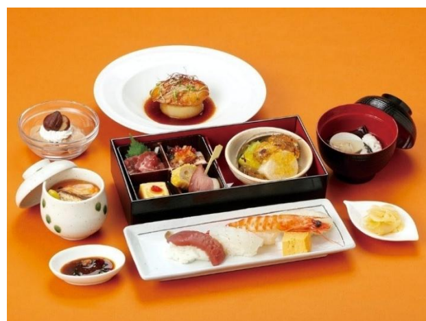
2便 ランチコース 料理イメージ