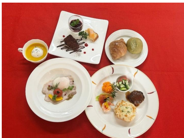
1便 ブランチコース 料理イメージ