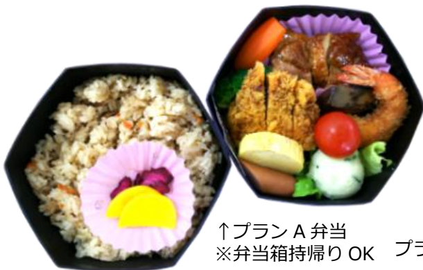
↑プラン A 弁当 ※弁当箱持帰り OK プラン D 弁当→