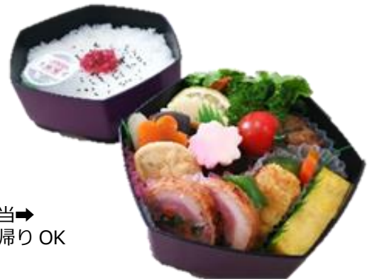
特製和風弁当→ ※弁当箱持帰り OK