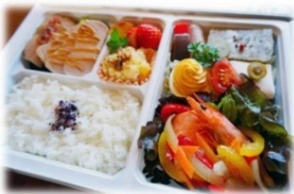
←特製 フレンチ弁当