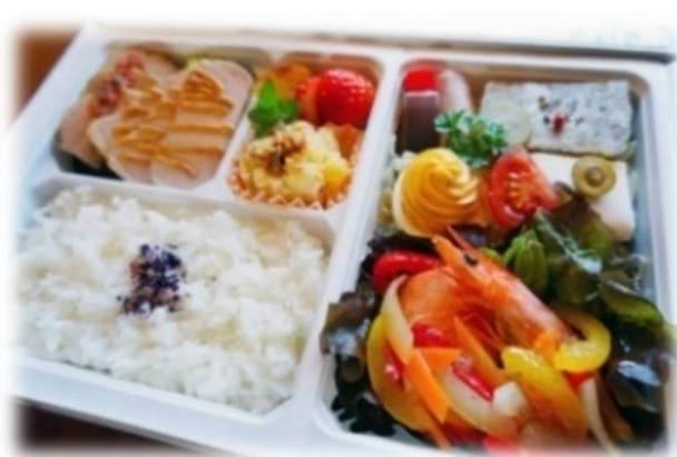
←特製 フレンチ弁当