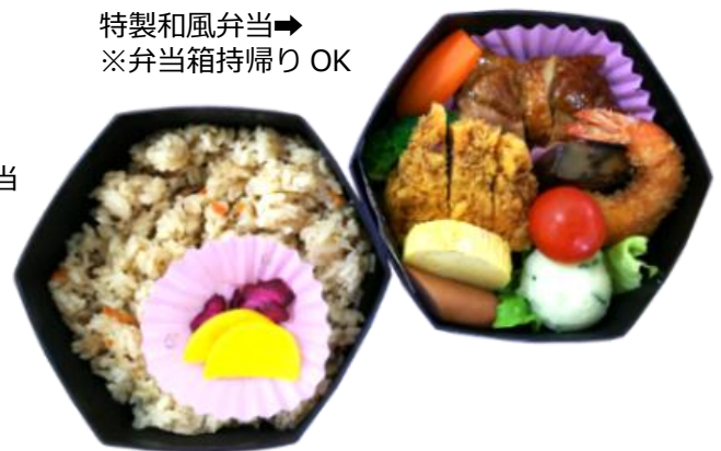
特製和風弁当→ ※弁当箱持帰り OK