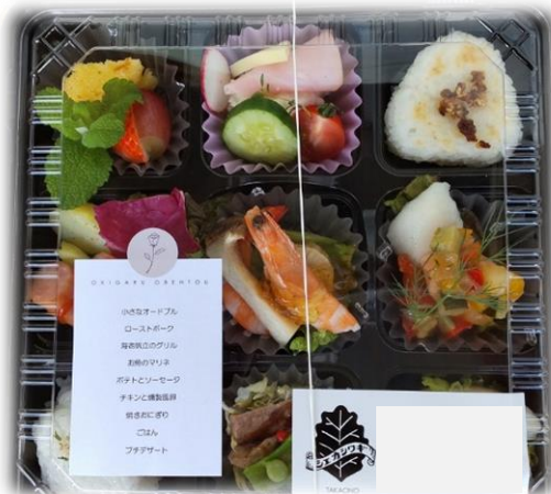
←特製 フレンチ弁当