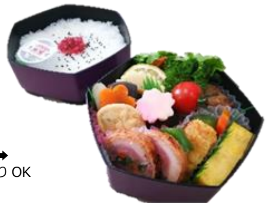
特製和風弁当→ ※弁当箱持ち帰り OK