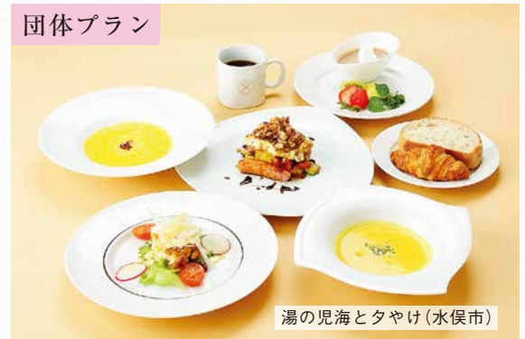
湯の児海とタヤけ(水俣市)