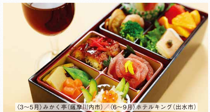
〈3～5月〉みかく亭(薩摩川内市) / 〈6～9月〉ホテルキング(出水市)

地元食材を知り尽くした料理人がお酒の美味しさを引き出す料理に腕をふるっています。(お酒とセットプランになります。)