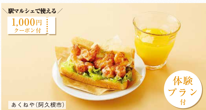
駅マルシェで使える /